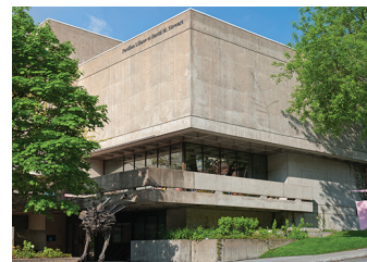
PAVILLON Liliane et David M. Stewart

S1 Cinéma du Musée Auditorium Maxwell-Cummings Entrée située au 1379A, rue Sherbrooke O.