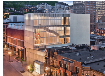
Pavillon pour la Paix Michal et Renata Hornstein

1 Arts décoratifs et design Section temporairement fermée