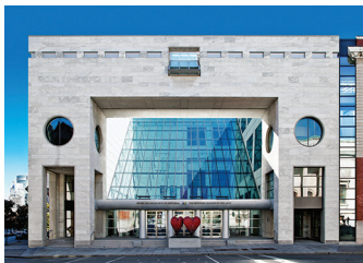
PAVILLON Jean-Noël Desmarais