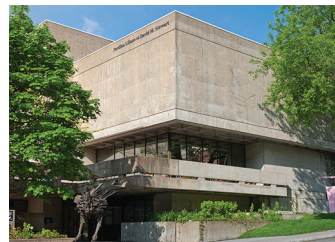
PAVILLON Liliane et David M. Stewart