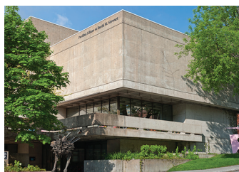
PAVILLON Liliane et David M. Stewart

S1 Cinéma du Musée Auditorium Maxwell-Cummings Entrée située au 1379A, rue Sherbrooke O.