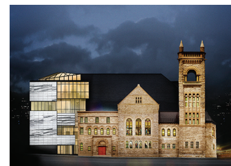
PAVILLON Claire et Marc Bourgie

1 Les Salons de la Belle Époque Avant-gardes modernes Abstraction et Figuration Art contemporain Accès aux autres pavillons