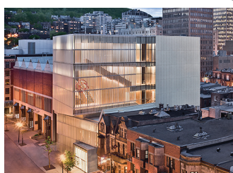
Pavillon pour la Paix Michal et Renata Hornstein

1 Arts décoratifs et design Section temporairement fermée