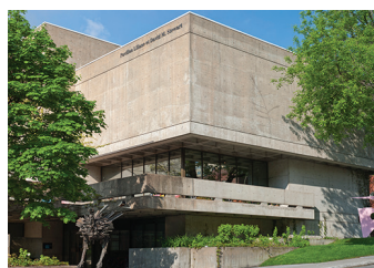
PAVILLON Liliane et David M. Stewart ARTS DÉCORATIFS ET DESIGN

S1 Cinéma du Musée Auditorium Maxwell-Cummings Entrée située au 1379A, rue Sherbrooke O.