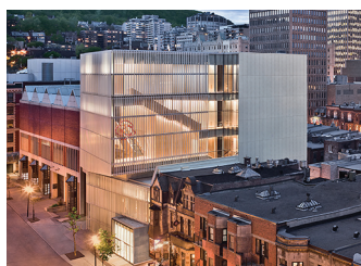
Pavillon pour la Paix Michal et Renata Hornstein ART INTERNATIONAL ET ÉDUCATION

1 Arts décoratifs et design Section temporairement fermée