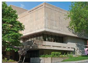
PAVILLON Liliane et David M. Stewart

S1 Cinéma du Musée Auditorium Maxwell-Cummings Entrée située au 1379A, rue Sherbrooke O.