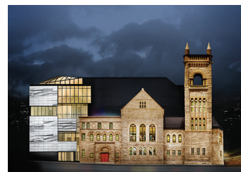
PAVILLON Claire et Marc Bourgie

1 Les Salons de la Belle Époque Avant-gardes modernes Abstraction et Figuration Art contemporain Accès aux autres pavillons