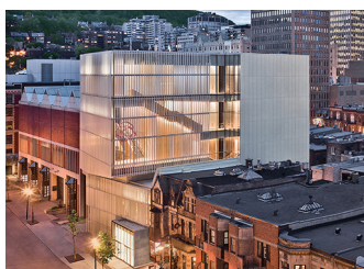
Pavillon pour la Paix Michal et Renata Hornstein

1 Arts décoratifs et design Section temporairement fermée